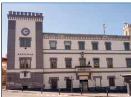
MUNICIPIO - OTTAVIANO