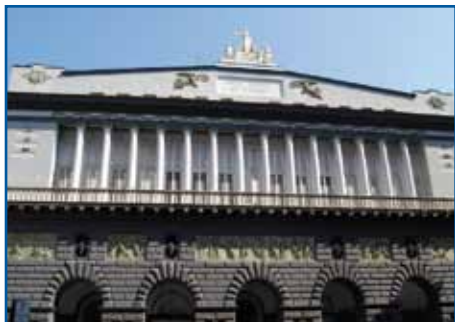
TEATRO SAN CARLO - NAPOLI