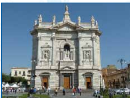
SANTUARIO DI SAN GIUSEPPE VES.NO