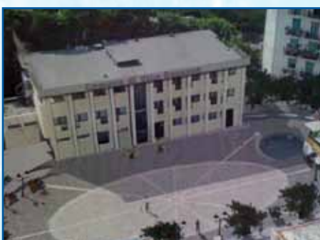
P.ZZA KENNEDY - VICO EQUENSE