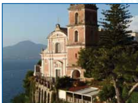
CATTEDRALE - VICO EQUENSE