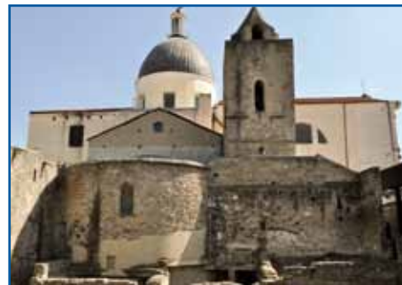
BASILICHE PALEOCRISTIANE - CIMITILE