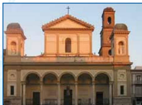
CATTEDRALE DI NOLA