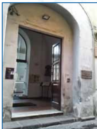
MUSEO ARCHEOLOGICO NOLA