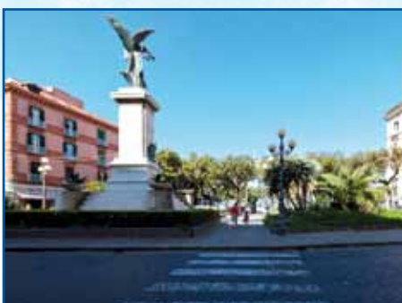
PIAZZA MONUMENTO CASTELLAMMARE DI STABIA