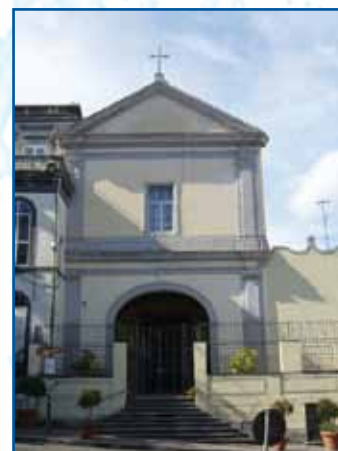
CHIESA DI S. FRANCESCO DI P. OTTAVIANO