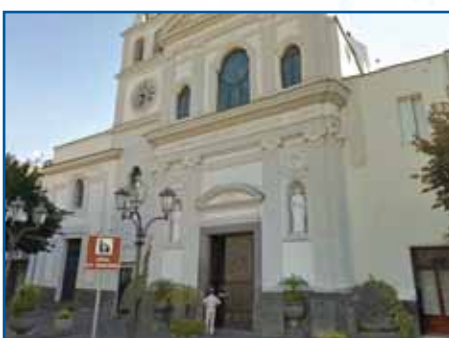
CHIESA DELL'IMMACOLATA TERZIGNO