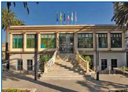
SCAVI DI ERCOLANO