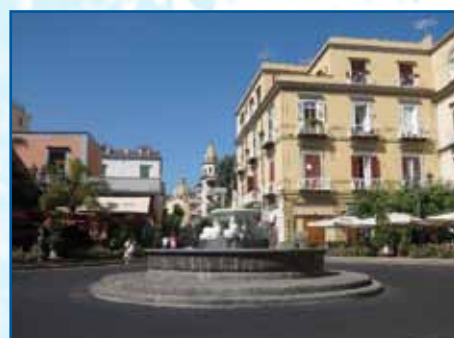
P.ZZA UMBERTO I - VICO EQUENSE