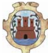
COMUNE DI VICO EQUENSE