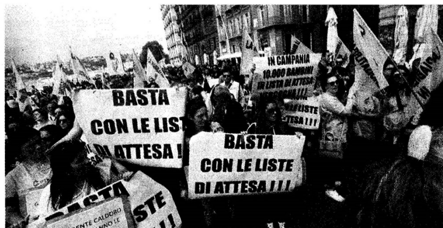
Un momento della protesta di ieri