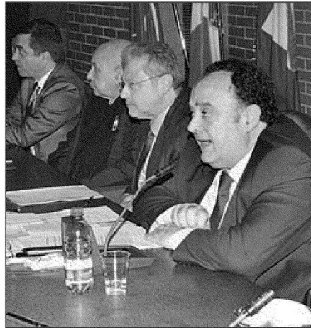
Il tavolo dell'assemblea generale Aiop, Anfas, Anisap, Anpric, Aspat, Confapi, Confindustria Sanità e Federlab Riabilitazione