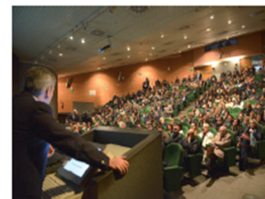
Assemblea del Coordinamento Associazioni di Categoria - Napoli 6 febbraio 2015