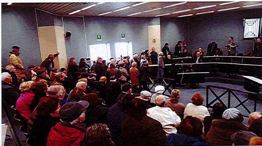
Assemblea Pubblica Centri Diabetologici Privati della ASL Napoli 2 Nord 26 Gennaio 2016