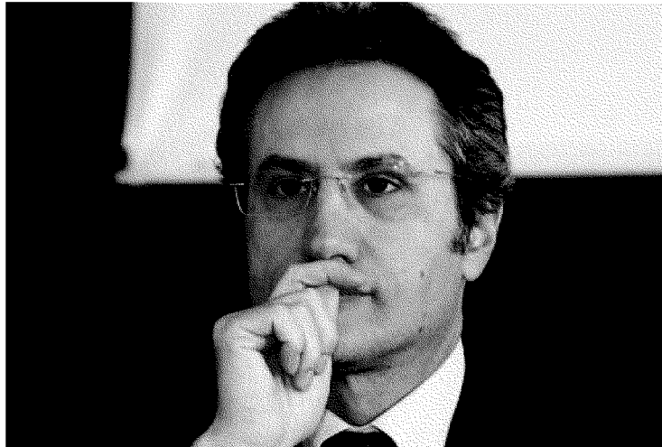
●—Il governatore Stefano Caldoro

IL PROVVEDIMENTO. Per effetto del provvedimento, a partire da ieri viene innalzato da 13 mila a 15mila euro il limite reddituale per accedere all'esenzione E10 (patologia cronica o malattia rara), condizione che appartiene al 50% circa dei cittadini. Dopo l'abolizione della quota regionale sulla compartecipazione in vigore dal primo gennaio scorso continua l'attività per rendere efficace ed allargare l'esenzione, avviata nell'ottobre scorso in conseguenza del completamento del rientro dal debito, con la riduzione dei ticket sanitari nella farmaceutica, l'assistenza specialistica ambulatoriale e le prestazioni terminali, i codici bianchi di pronto soccorso. La prossima scadenza è prevista per il primo maggio.