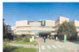
RIVOLUZIONARIO Il 12 luglio, all'Humanitas si parlerà del metodo

Non poteva mancare anche il prelievo di sangue premetterà di approfondire lo studio sui marcatori molecolari del tumore: in pratica con la "biopsia liquida" si analizzano molecole e cellule per scoprire, se nei soggetti a rischio vi siano nel sangue cellule tumorali, frammenti di geni tumorali o particolari proteine. Nello screening è compresa anche la TAC toracica a basso dosaggio, associata ad una intensa attività antifumo: la TAC permette di calcolare il grado di calcificazione delle arterie coronariche, che è direttamente proporzionale al rischio di infarto o di stenosi delle coronarie. Inoltre sono previsti alcuni esami tra cui calcio coronarico alla TC e spirometria, per il rilevamento del rischio cardiovascolare e diagnosi precoce dell'enfisema e della broncopneumopatia cronica ostruttiva (BPCO).