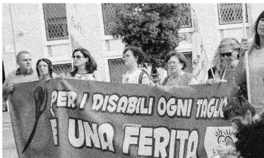
LA RETROMARCIA È arrivata dopo una nota del manager dell'Asl, D'Amore

► I centri privati di Napoli Nord hanno rinunciato alla serrata ► È stata paventata la possibilità d'interruzione di pubblico servizio