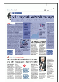
Peso: 1-6%, 25-43%