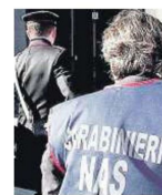
CONTROLLI I militari del Nas

IL CASO A lato il cartello comparso nei giorni scorsi al Moscati di Aversa, sotto i carabinieri del Nas che ieri hanno eseguito controlli nel plesso