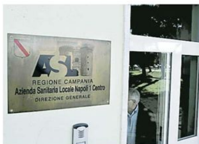
▲ Sede Gli uffici dell'Asl Napoli 1