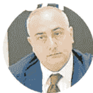
Ciro Verdoliva Direttore generale Asl Na 1