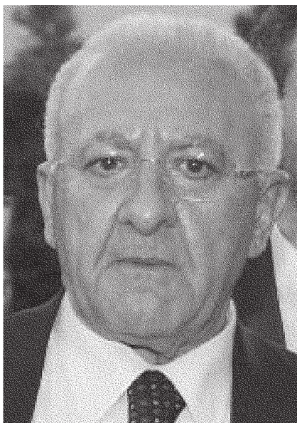
NELLA FOTO: IL GOVERNATORE DELLA CAMPANIA, VINCENZO DE LUCA. ACCANTO: LA SEDE DELL'ASL DI AVELLINO IN VIA DEGLI IMBIMBO

Primo piano / Sanità, conflitto sulle nomine