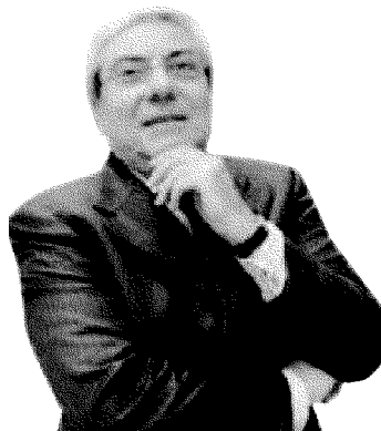
SOCIOLOGO Giuseppe Roma, direttore generale del Censis

«Quando va a coprire servizi professionalizzati di cui c'è assoluta necessità, visto che il taglio ai redditi ha messo in crisi le soluzioni fino ad oggi attuate dalle famiglie. Penso al crollo del ricorso alle badanti, per esempio. Abbiamo appena fatto uno studio che sull'introduzione dei voucher universali per i servizi alla persona: possono generare 200 mila posti di lavoro in cinque anni».