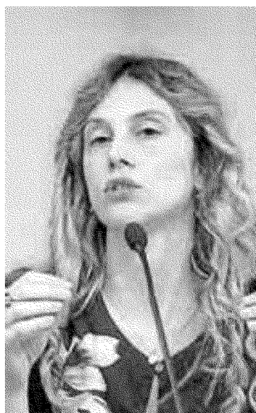
Il ministro Madia titolare del dicastero della pubblica amministrazione

Una riforma che però non dovrà pesare sui conti dello Stato: dall'attuazione delle deleghe contenute nel provvedimento non devono derivare nuovi o maggiori oneri a carico della finanza pubblica. Plauso dalle associazioni, anche perché l'intervento era atteso almeno da due decenni, rimarca il Forum del Terzo Settore che ora però chiede di non mettere troppi paletti ma piuttosto di favorire il mondo del volontariato che coinvolge in Italia cinque milioni di persone. Bond di solidarietà: verranno introdotti meccanismi volti alla diffusione dei titoli di solidarietà e di altre forme di finanza sociale. Il meccanismo del 5 per mille, oggi ancora da finanziare ad ogni legge di stabilità, diventerà permanente. Prevista anche l'introduzione di una tassazione che tenga conto non solo delle finalità solidaristiche delle onlus ma anche del divieto di ripartizione degli utili. In questo ambito verranno anche riviste tutte le agevolazioni, detrazioni e deduzioni, fisca-