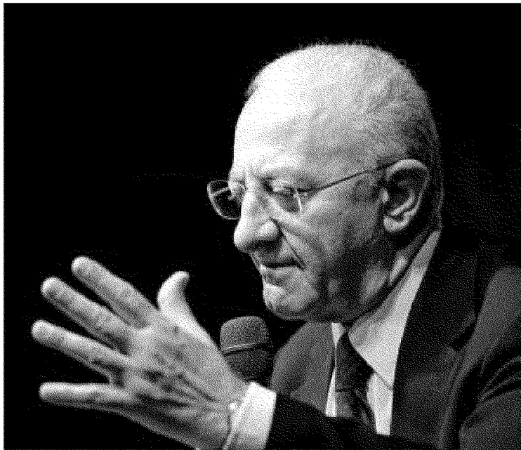
Vincenzo De Luca

Per il presidente della commissione sanità Raffaele Topo il provvedimento approvato «E' solo il primo atto di una riforma che interesserà il settore sanitario in Campania. Una legge ap-