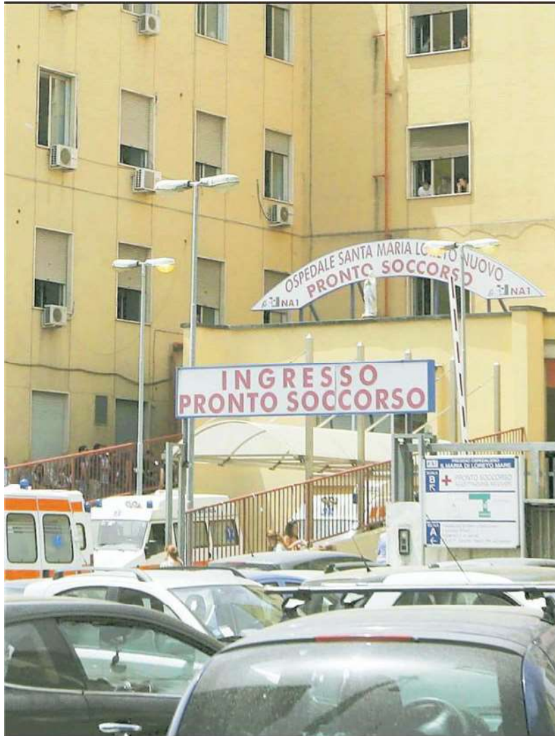
▲ L'ospedale Il Loreto Mare