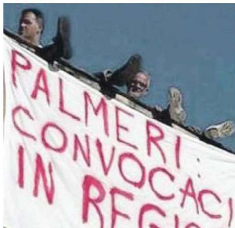
LA PROTESTA Operai dell'azienda di Melito sul tetto del Cardarelli, a destra l'interno dello stabilimento