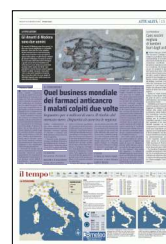
Peso: 1-7%, 15-30%

De Lorenzo: «Pericolo di tossicità e di assunzione senza alcun controllo»