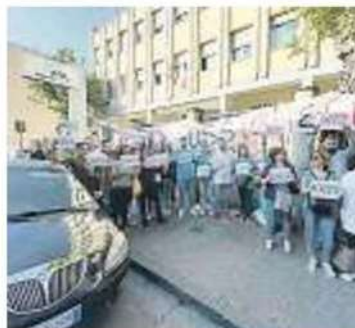
Protesta Il sit in all'asl

DOVRANNO LASCIARE IL POSTO A VINCITORI DI CONCORSO: «CI HANNO USATI PER RIEMPIRE I VUOTI E BUTTATI VIA»