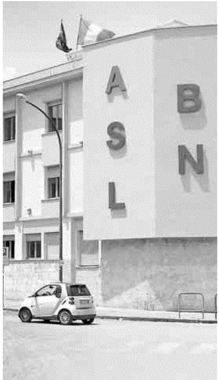
Azienda sanitaria Pronta la griglia degli aspiranti al ruolo di direttore generale