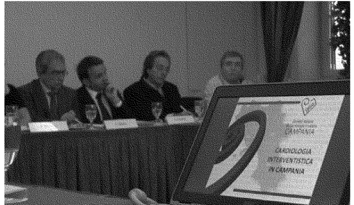
Il simposio all'Hotel Alabardieri

Tra le innovazioni emerse c'è l'imminente creazione di uno studio multicentrico italiano e un registro osservazionale che si prefigge di valutare i benefici a lungo termine del dispositivo.