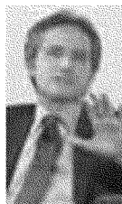
Caldoro Per il governatore «l'ospedale non si tocca»