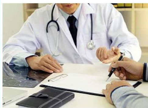
Lo studio, ubicato in via Roberto Bracco 15/a a Napoli – tra Piazza Municipio e di Piazza Matteotti – è oggi un punto di riferimento per l'utenza napoletana e non solo. Oltre all'ubicazione il punto di forza della struttura sono i macchinari

Negli ultimi anni lo studio è stato rinnovato e migliorato in ogni suo aspetto, con nuovi ambienti più accoglienti e nuove tecnologie. tra le moderne apparecchiature sono state aggiunte una TAC spirale multistrato (32 strati) ed una TC Dentalscan Cone Beam: una nuova metodologia diagnostica che consente di avere una ricostruzione tridimensionale delle ossa del cavo orale e mascellare. Ogni anno allo studio Sandomenico si aggiungono nuovi servizi.