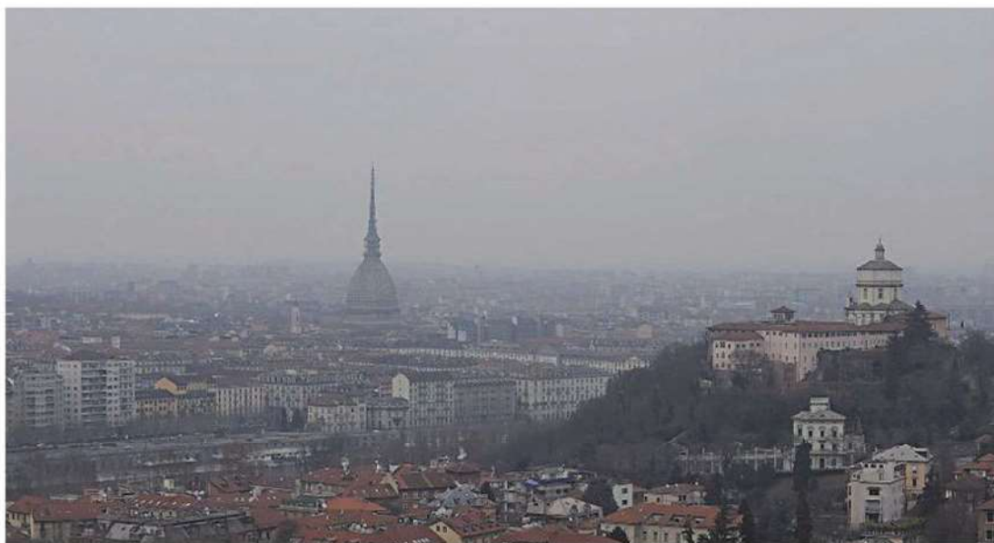
Torino avvolta dallo smog. È la città più inquinata d'Europa con Parigi e Londra

Le città già "fuorilegge", secondo Legambiente, per il superamento del limite annuale di polveri sottili