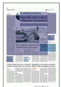
LA DECISIONE L'ospedale di Sorrento. Nel tondo il documento dell'Asl 3 Sud che annuncia lo stop