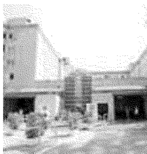
Sanità L'ospedale di Nocera Inferiore