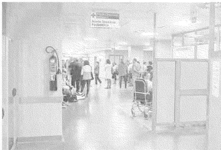
Lo scontro Secondo i sindacati la gestione commissariale punta a ridurre le spese a ogni costo, penalizzando la qualità

Nel bando è riportata una base d'asta di 2.722.443,38 euro e l'appalto verrà aggiudicato con un ribasso di questa cifra. Ed è proprio questa la nota dolente evidenziata dai sindacati, perché la cifra è circa la metà dell'attuale canone pagato per l'erogazione dei servizi. In questo momento il personale del servizio di pulizia conta 112 unità, 85 a full time e 27 con l'80% dell'orario pieno.