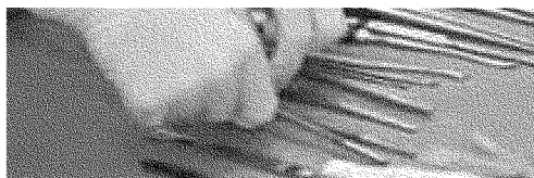
Riparazione di aneurisma non rotto dell'aorta addominale: mortalità a 30 giorni