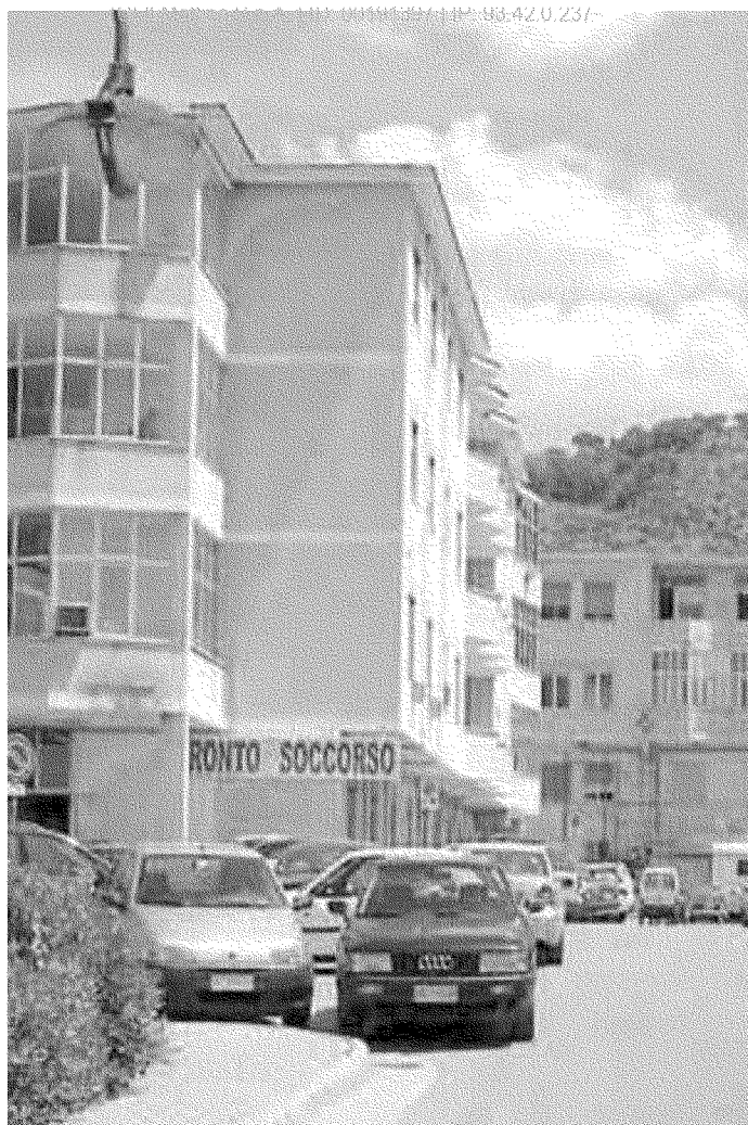
L'ospedale A Maddaloni enorme richiesta di esami diagnostici in radiologia