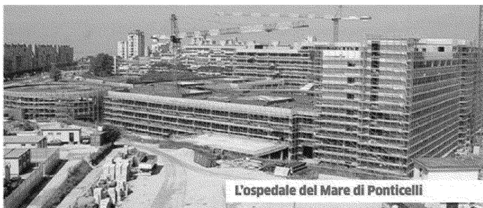
L'ospedale del Mare di Ponticelli

"La diversità dei lavori - spiega Squillante - ha reso necessaria una progettazione integrata, unitaria e coerente che, pertanto, è stata affidata ad un unico staff tecnico di progettazione prevedendone l'esecuzione per stralci esecutivi successivi che rispettino determinate priorità già fissate. •••