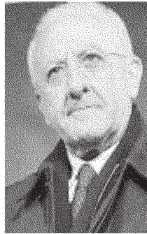
Enzo De Luca e sotto il ministro Lorenzin