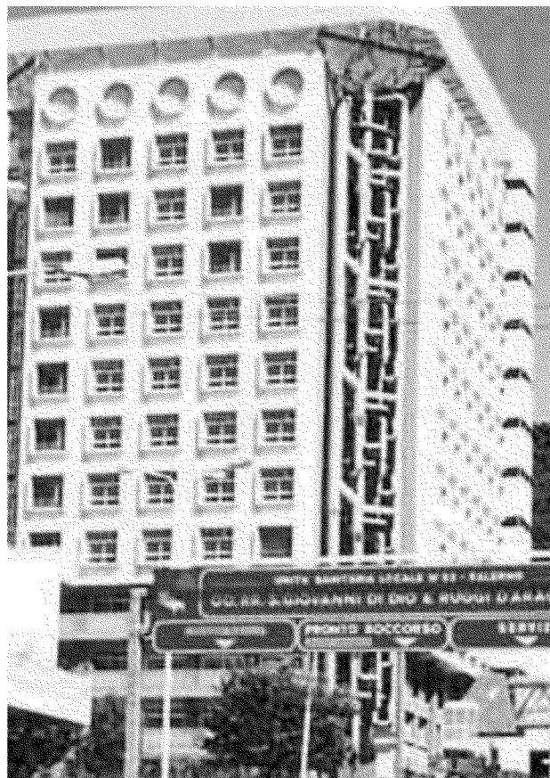
Azienda ospedaliera universitaria Al vaglio il piano ferie al Ruggi