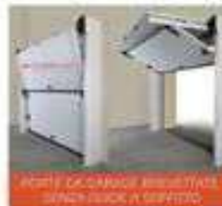
FORTE DA GARARE BREVETTATE SENZA GUIDE A SCORRITO