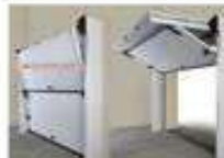
FORTE DA GARARE BREVETTATE SENZA GUIDE A SCORRITO