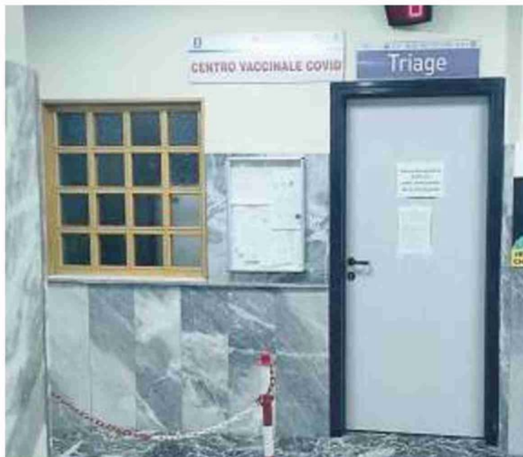
SCAFATI Il centro vaccinale