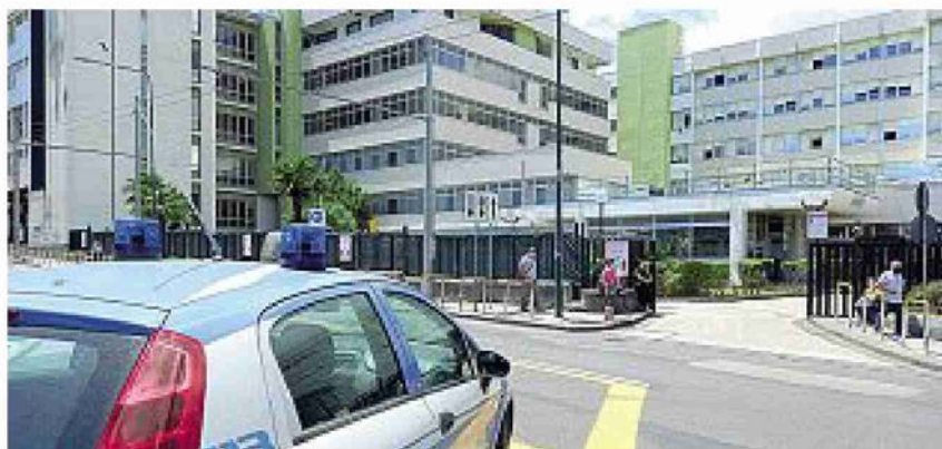
Ospedale L'ingresso del Pronto soccorso del Cardarelli

si spendono in media 100 euro in più a cittadino rispetto al Sud. E per la Corte gli indici di valutazione dei LEA sono una testimonianza delle differenze tra i sistemi sanitari regionali.