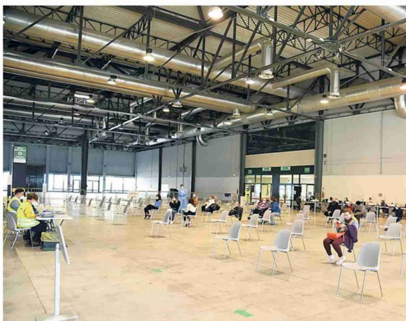
Il centro per le vaccinazioni semivuoto alla Fiera di Cremona

Procedono a rilento le consegne dei vaccini. Mancano le dosi e si prosegue con 200 mila immunizzazioni al giorno. -P.2 SERVIZI- PP.2-5