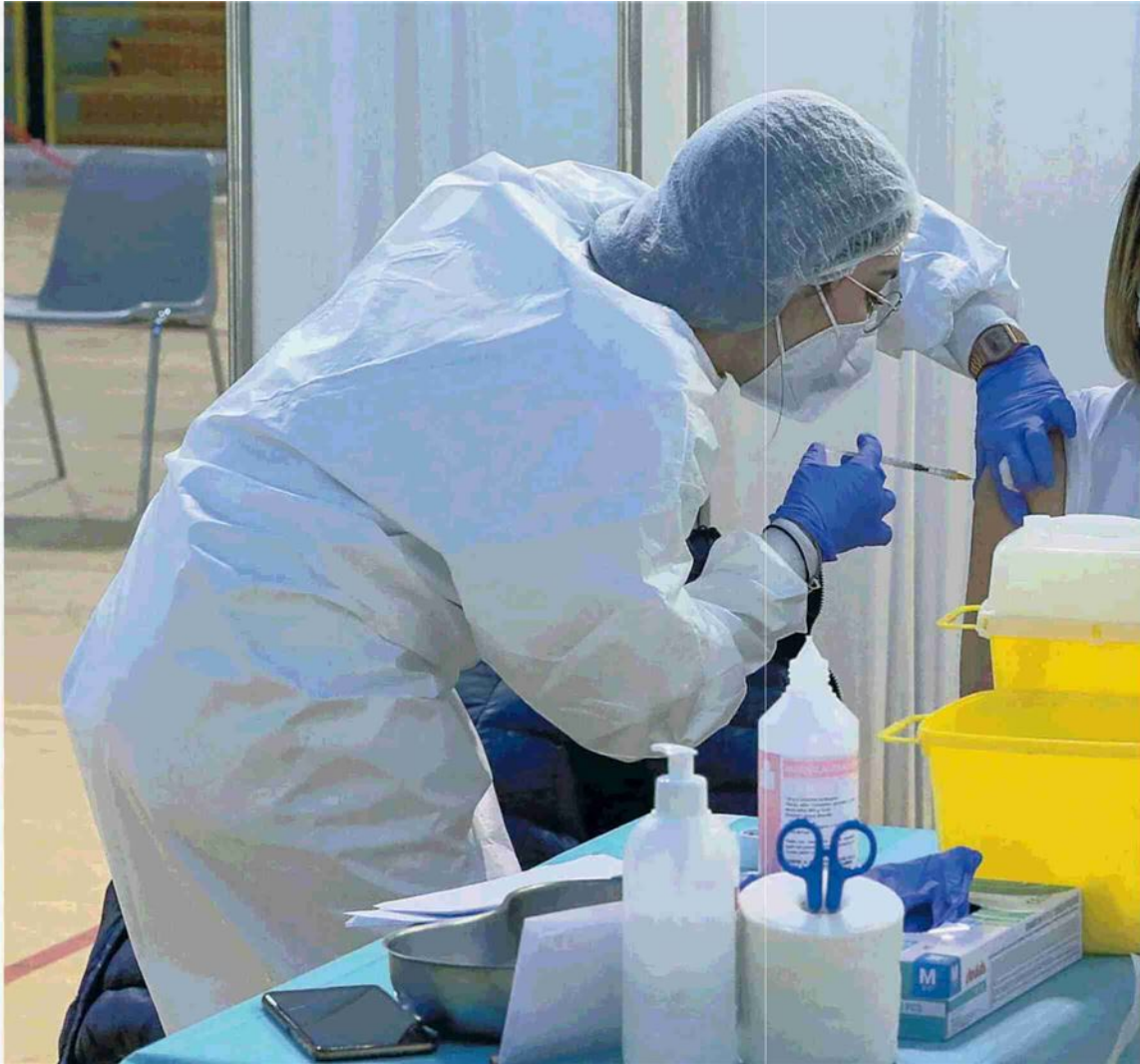
La vaccinazione degli insegnanti a Novara