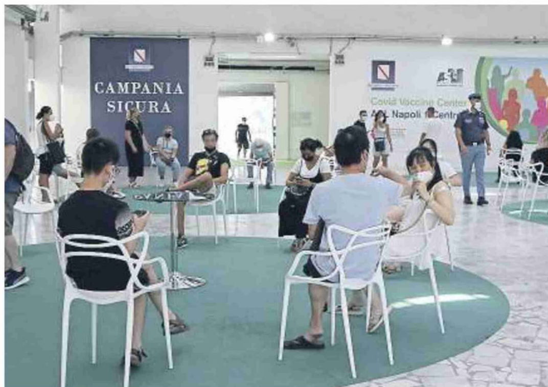
LA CAMPAGNA VACCINALE Al via gli Open day: sette giorni senza prenotazioni negli hub della città

«CE LA STIAMO METTENDO TUTTA LA ASL NAPOLI 1 RESTA IN CAMPO PER CONVINCERE INDECISI E NO VAX»