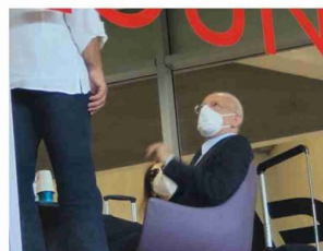
I vaccini e gli assembramenti alla stazione centrale sotto gli occhi del governatore che resta a guardare