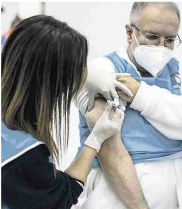
IL VACCINO Pronte le fiale ma è scontro su chi deve avere priorità