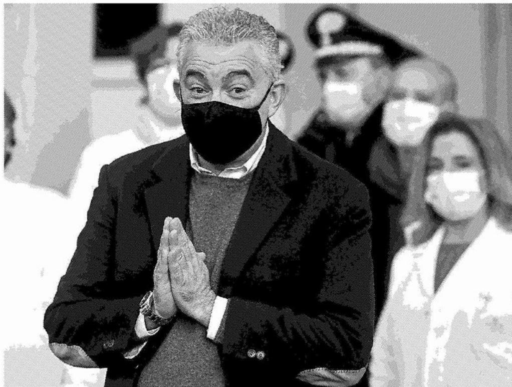
Il commissario per l'emergenza Covid Domenico Arcuri

Il commissario: "L'annuncio di Von der Leyen dà più serenità al nostro piano"