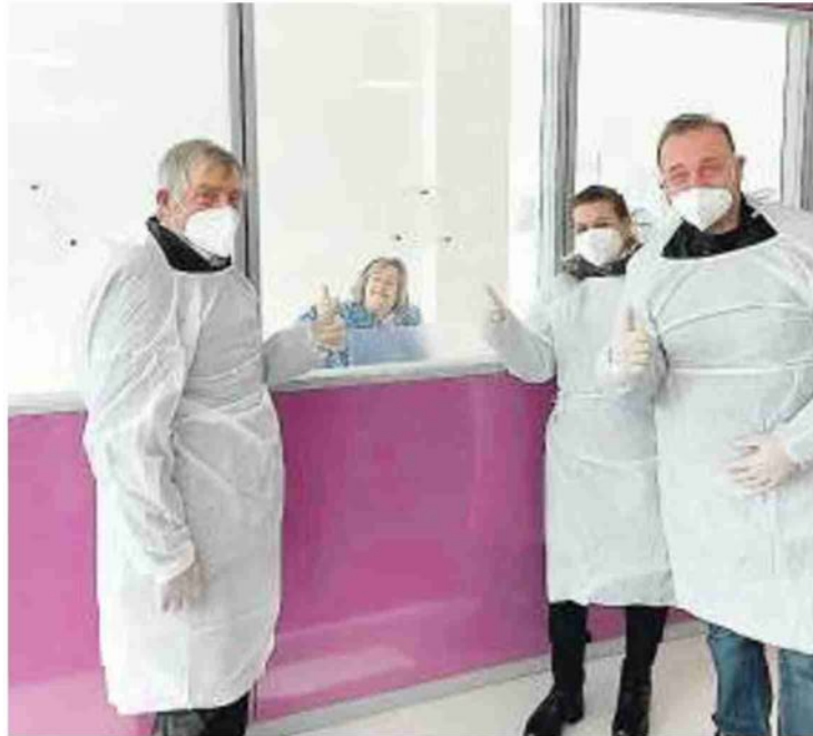
IL PROGETTO La stanza per gli abbracci con gli occhi