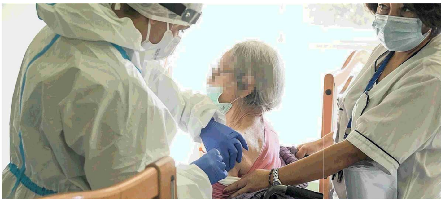
La paziente di una Rsa sottoposta alla vaccinazione contro il Covid-19

I nuovi positivi nelle ultime 24 ore, 329 i decessi, +37 i ricoveri in terapia intensiva