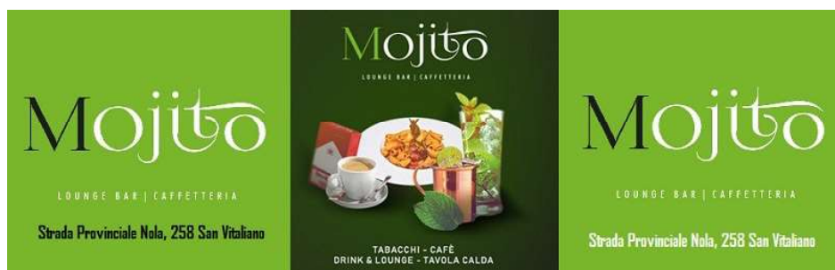
( https://www.facebook.com/mojitolobar/ )

Polizzi Aspat in prima linea per la salute mentale /regionali-cosa-ne-pensi-di-una-eventuale-alleanza-pd-5s/