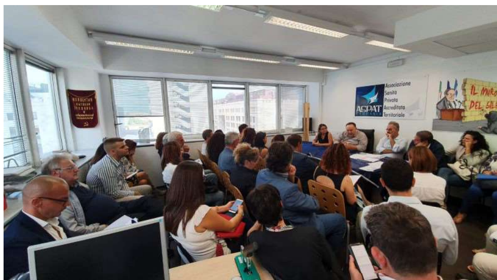
( http://www.ilmonito.it/wp-content/uploads/2019/10/aspas.jpg )

VOTA I SONDAGGI ( HTTP://WWW.ILMONITO.IT/REGIONALI-COSA-NE-PENSI-DI-UNA-EVENTUALE-ALLEANZA-PD-5S/ )