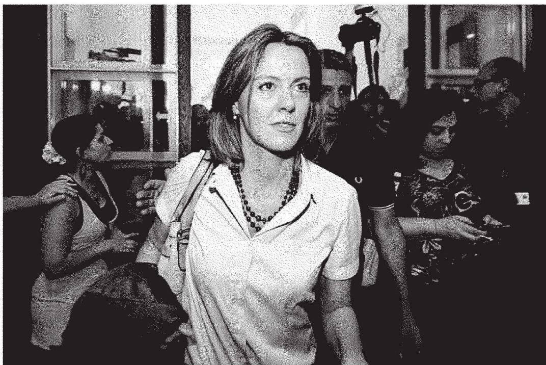
Il vertice Ieri il governatore Vincenzo De Luca ha incontrato il ministro Beatrice Lorenzin per discutere del nodo dei contratti con i centri privati accreditati

La Regione invita le parti alla prudenza e a sospendere iniziative sindacali